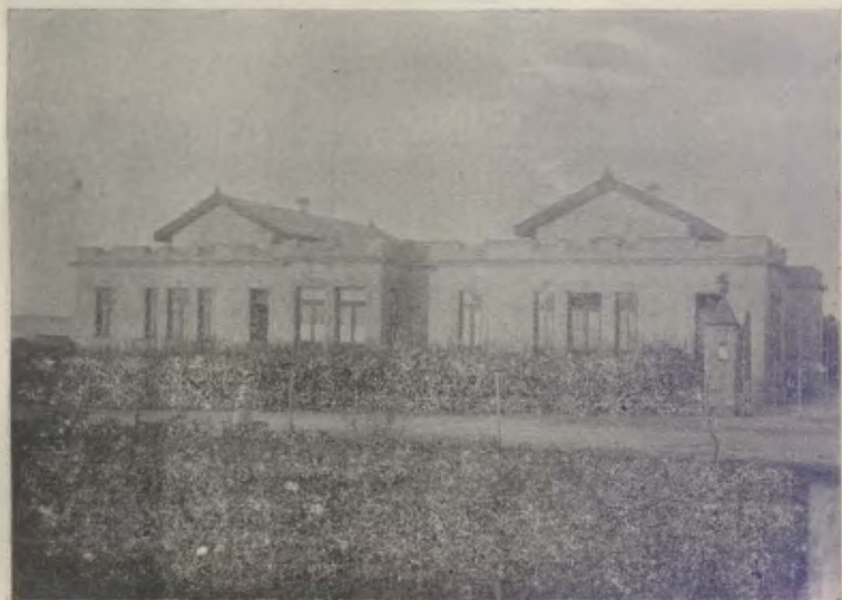
Parte lateral de Hospital