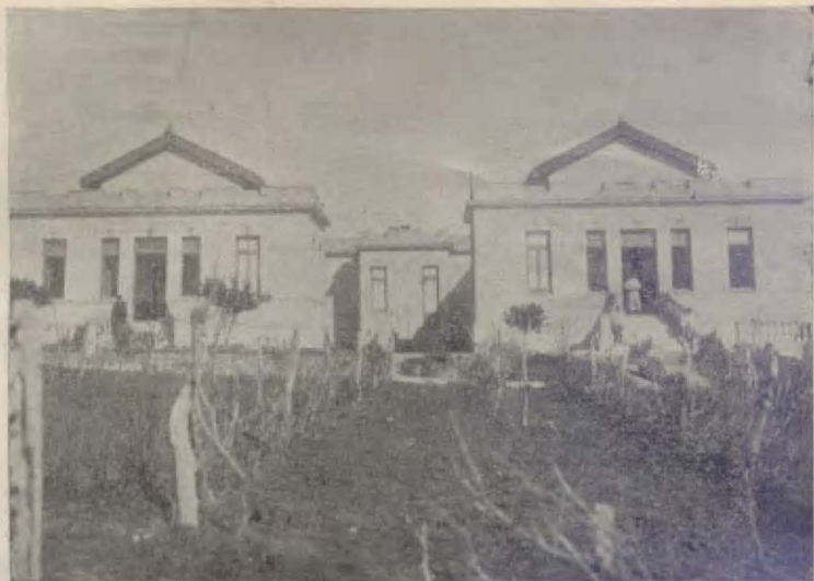
Frente del Hospital