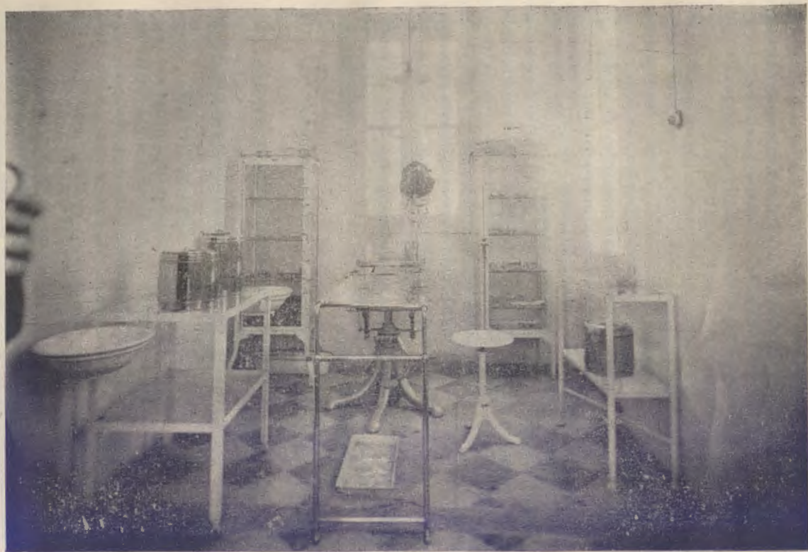
Sala de operaciones